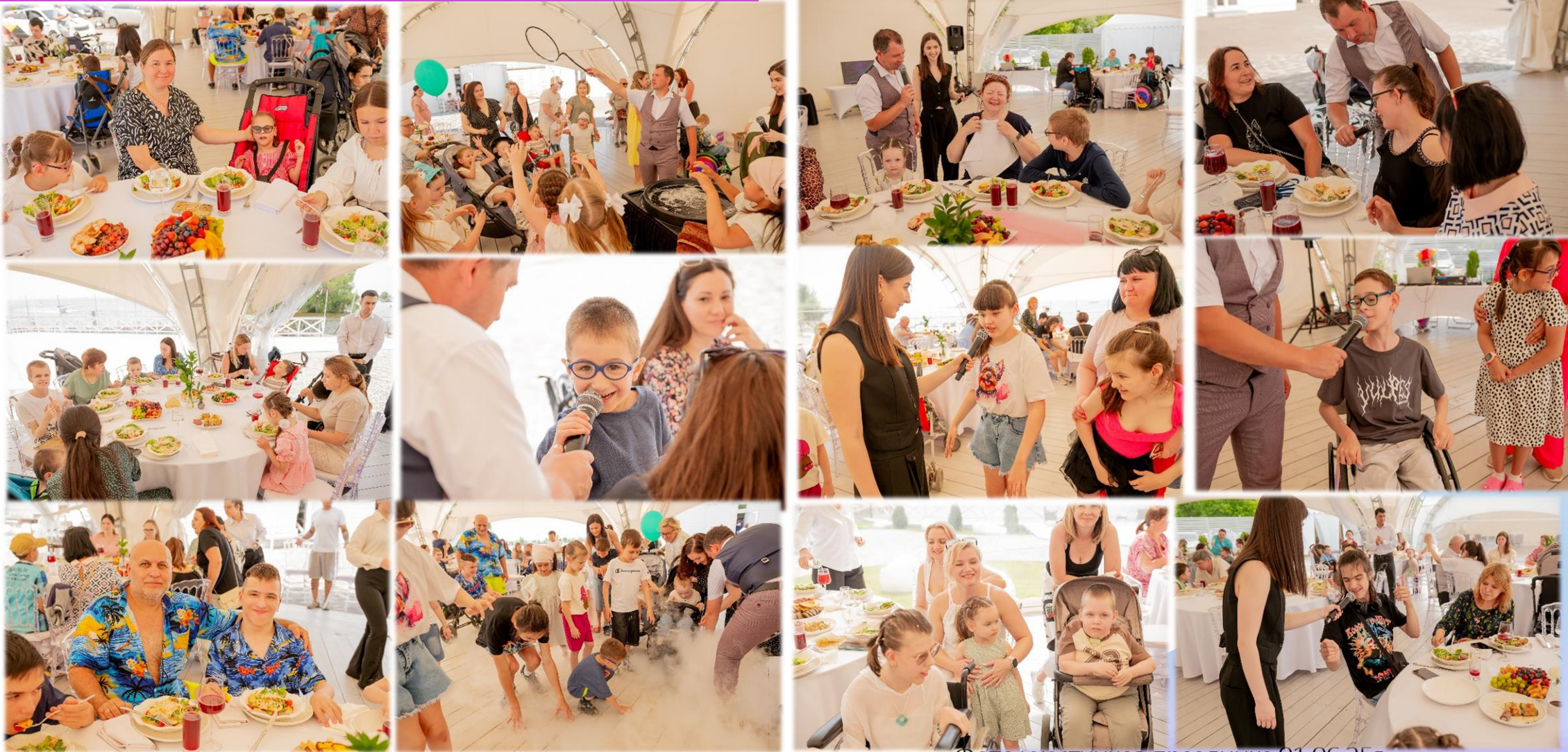
Фото участников праздника 01.06.25г.