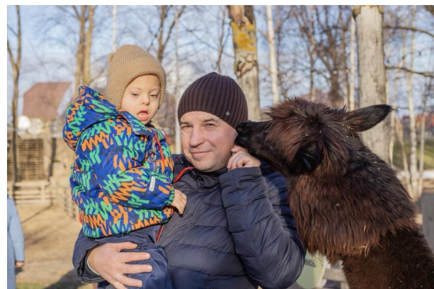
Фото участников ЭКСКУРСИИ 2025г.