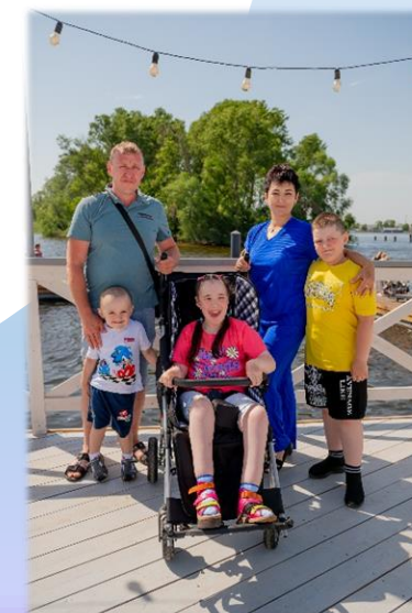
Фото участников праздника 01.06.25г.