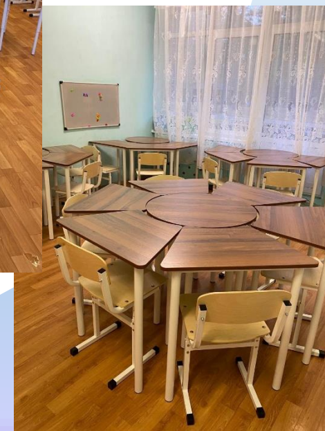
Фото предоставлены благополучателями 2025г.