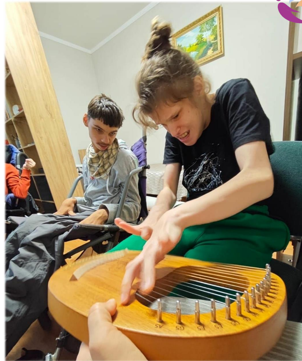
Фото участников проекта «Особое взросление 18+»

Что происходит на занятиях: Творчество (работа с глиной, воском, рисование, музицирование); Телесная терапия; Игры и общение; Развитие бытовых навыков в непринужденной форме; Подготовка представлений к праздникам с непосредственным включением ребят