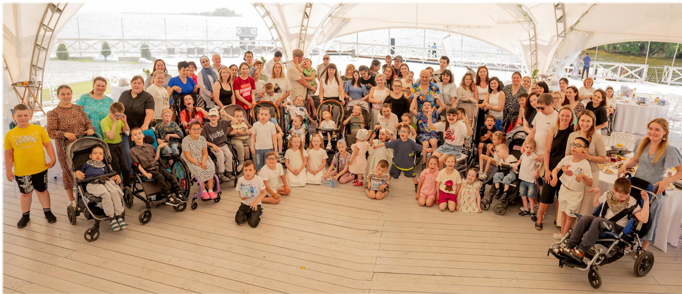
Фото участников праздника 01.06.25г.