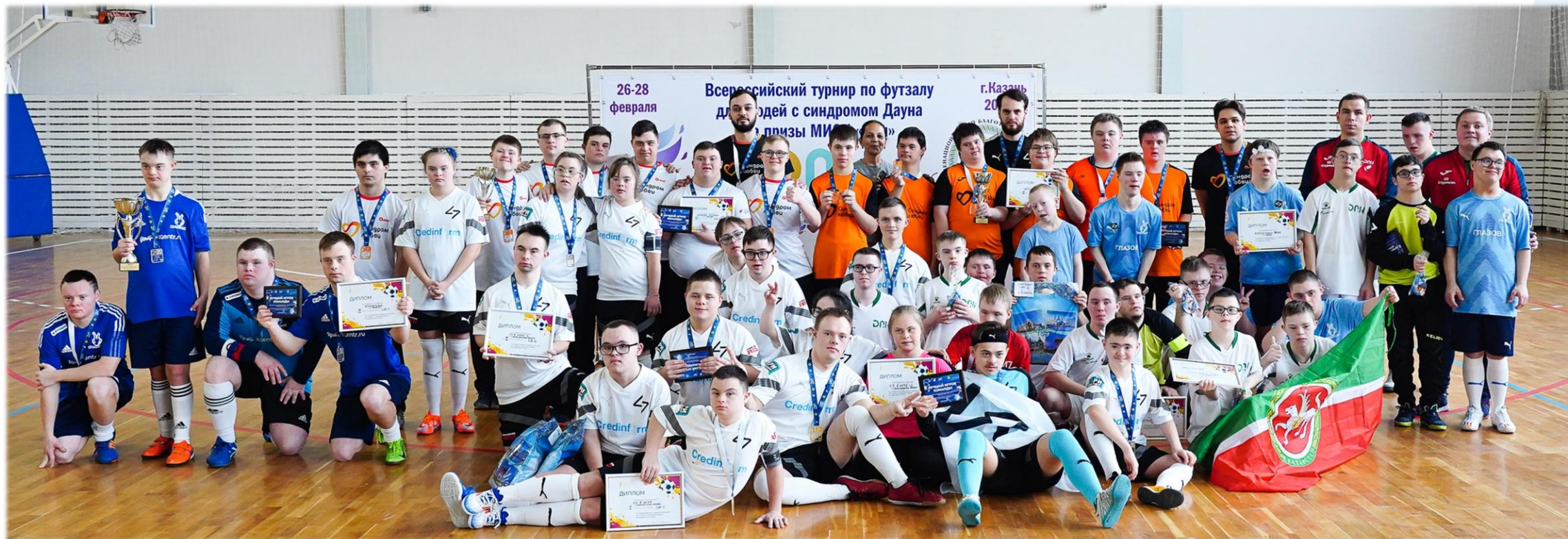
Фото участников проекта 26.02.25-28.02.25